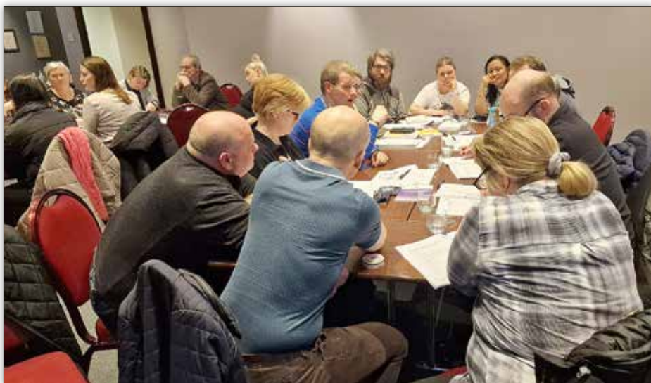
Frá fundi samninganefndar Einingar-löju fyrir á árinu. Í lok apríl var kröfugerð félagsins gagnvart stjórnvöldum og fyrir samningana á almenna markaðinum samþykkt og send til SGS sem punktar félagsins inn í kröfugerð sambandsins.

Lögð er áhersla á áframhaldandi hækkun lægstu launa og að tryggja kaupmátt launafólks. Krónutölhækkanir á laun, eins og samið