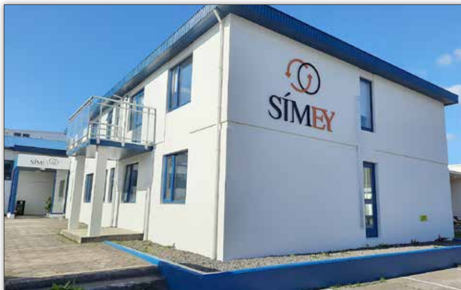
Húsnæði Símenntunarmiðstöðvar Eyjafjarðar við Þórsstíg á Akureyri.

SÍMEY hefur sannarlega mikilvægu hlutverki að gegna við að hækka menntunarstig á starfssvæði miðstöðvarinnar. Starfsfólk býr yfir mikilli þekkingu og reynslu og leggur sig fram um að þjónusta fólk eins vel og þess frekast er kostur. Það er gömul saga og ný að fyrir marga sem ekki hafa setið lengi á skólabekk er oft stærsta