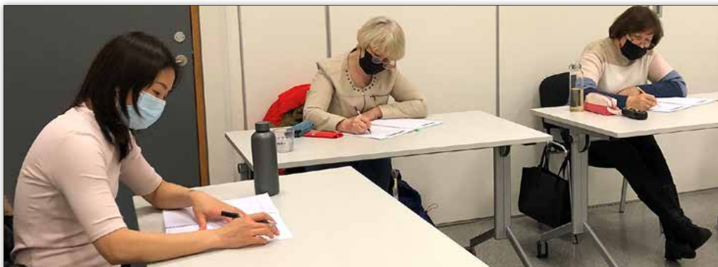
Nemendur á námskeiðinu „Íslenska sem annað mál“ í SÍMEY.

Allar upplýsingar um það sem SÍMEY stendur fyrir eru aðgengilegar á heimasíðu miðstöðvarinnar – www.simey.is og auk þess er starfsfólk SÍMEY fúst að veita allar upplýsingar og leggja fólki lið á allan hátt.