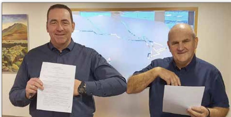
Kampakátir formenn að lokinni undirskrift.

Eiður sagði að þetta væri tímamótasamningur. „Þetta gerir félagsmönnum auðveldara að fara á milli félaga og vera í réttu stéttarfélagi sem skiptir gríðarlegu miklu máli. Þá er ég að tala um að vera í því stéttarfélagi sem er með þann kjarasamning sem starfsmaðurinn er að fá greidd laun eftir. Loksins kláruðum við þetta og ég vona að þetta sé upphafið að fleiri svona samningum á milli allra stéttarfélaga.“