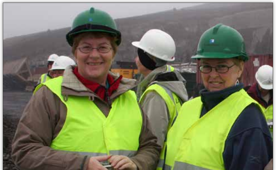
Ferð á Kárahnjúka 2006.

Þær hafa greinilega ekki fengið nóg hvor af annarri eftir allan þennan tíma sem vinnufélagar því núna búa þær í sama fjölbylishúsinu. „Við hittumst nú af og til, ekkert á hverjum degi. Við reynum samt svona annað slagið að fá okkur kaffisopa saman,“ segja þær að lokum.