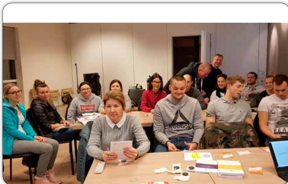
24 tóku þátt í námskeiðinu.