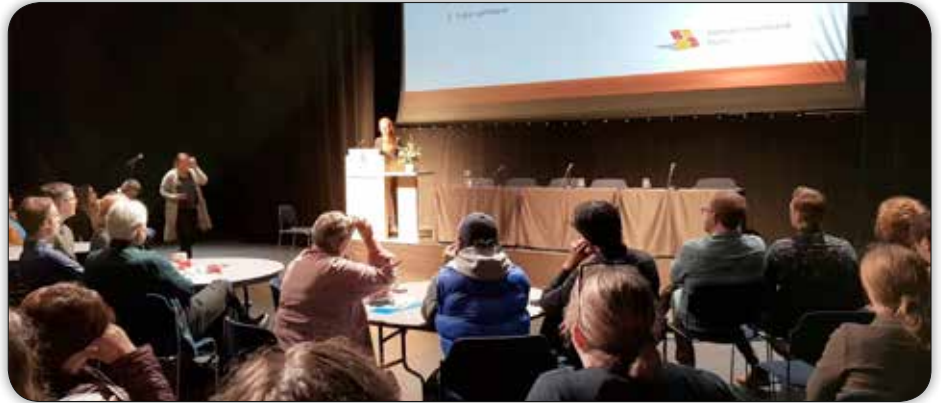
Rannveig kynningu niðurstöður rannsóknarinnar.

Eigindleg rannsókn var framkvæmd þar sem voru settir saman fjórir rýnihópar sem samanstóðu af konum af erlendum uppruna. „Niðurstöður rannsóknarinnar leiddu í ljós að